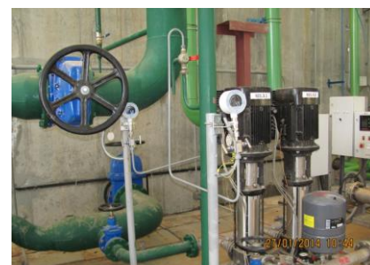
АСУ канализационной насосной станции.

2. ЗАО «Северсталь - Сортовой завод Балаково», ОАО «Северсталь», г. Балаково, Саратовская область, монтаж и пусконаладочные работы систем автоматики на объекте. Комплектация внутренней коммутации и сборке шкафов Rittal с использованием импортных комплектующих (промежуточные реле, автоматические выключатели, блоки питания, контроллеры) фирмы SIMENS, а так же приборов отечественного производства ведущих фирм: НПП «Элемер», ФГУП СПО «Аналитприбор» г.Смоленск, ООО «Эндрес+Хаузер», Германия. Прокладка контрольного и оптического кабеля, импульсных проводок на